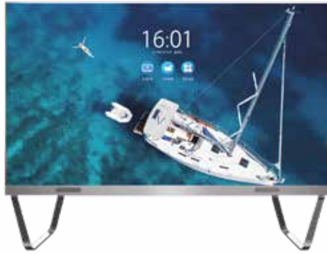
X-Board [High-End] Standardgrößen 108°/135°/163°/216°