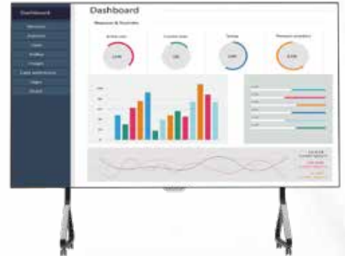
E-Board [Standard] Standardgrößen 135°/163°/216°